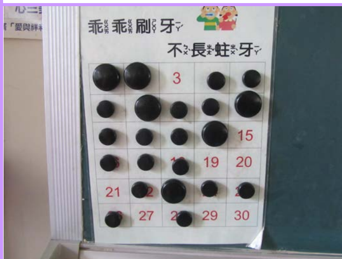
教室黑板設置潔牙完成登錄表格